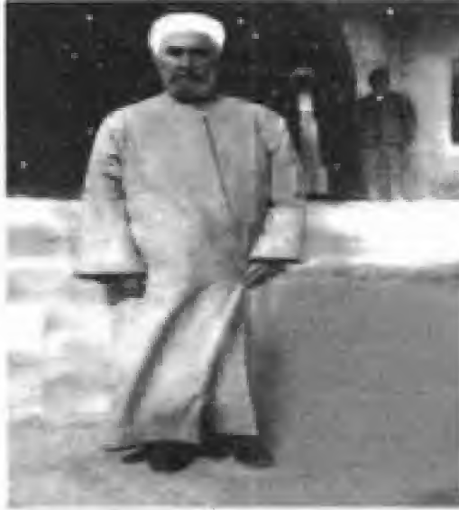
مه‌لای گه‌وره‌ی کۆبی

هه‌ تاده‌رم له‌بۆ کوردان ده‌نالم عیلاجیان چۆن بکه‌م هاوار به‌ مالم؟ ده‌ یی من که‌ یقی جیم به‌ دنیا یی قه‌ ومی من وا ره‌ زیل وریسوا یی؟!